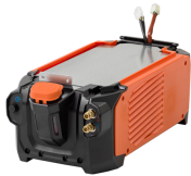
Master Cooler 05M

Koelunit voor eenvoudig, snel en handig koelvloeistof vullen met geïntegreerde led-verlichting voor koelvloeistofniveaus.