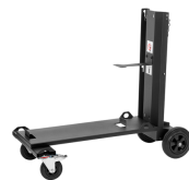
X3 4-wheel Trolley

Klassieke analoge afstandsbediening voor GXe Serie 5-toortsen voor geheugenkanaal- of draadaanvoeraanpassing. De nieuwe vorm is lichtgewicht, duurzaam en gemakkelijk te hanteren met lashandschoenen. De kanaalstap klik kan worden verwijderd door deze te verstellen met een kleine schroevendraaier. De kunststof is robuuster en de bevestiging van de oranje potentiometer is verbeterd.